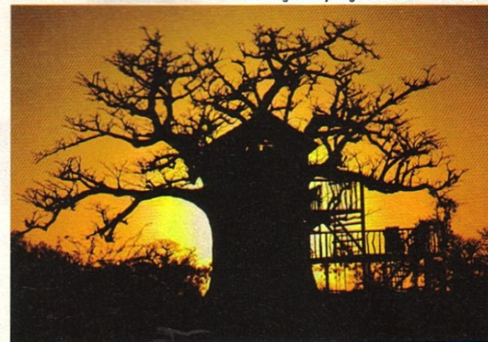
In Senegal kun je logeren in een baobab-boom.

Dat een steeds groter publiek zich het lot van het milieu en de lokale bevolking aantrekt, is inmiddels ook doorge-